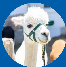
Alpalama Wanderung in Maierhöfen