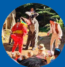
Waldfest mit Theater in Grünenbach