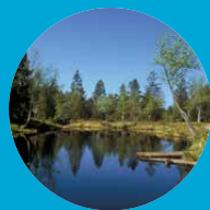
Wildrosenmoos bei Oberreute mit herrlicher Flora