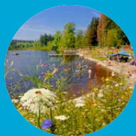
Waldseebad mit Naturlehrpfad in Lindenberg