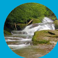
Eistobel bei Maierhöfen