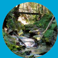
Hausbachklamm mit Wasserfällen und einer Seilrutsche